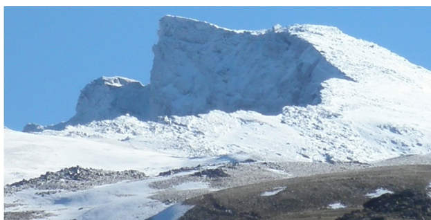
Corral del Veleta 12-11-19