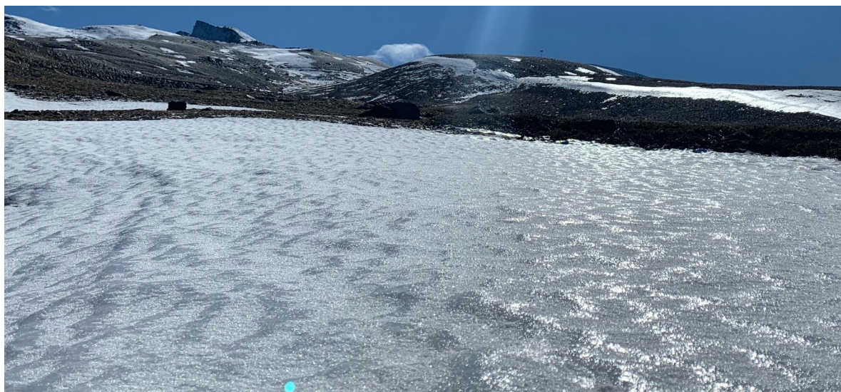
Bastantes placas de hielo 13-11-19