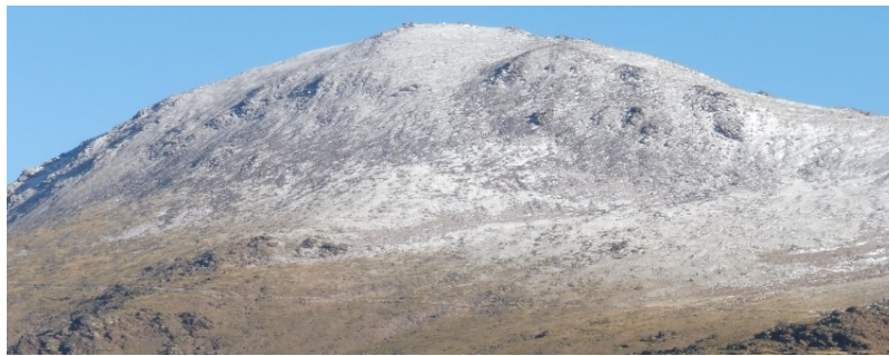
Cara sur Veleta Y Mulhacén 12-11-19