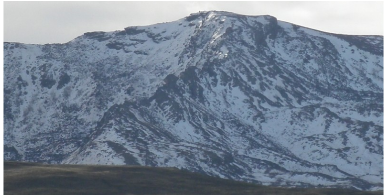
Veleta y Cartujo 18-11-2020