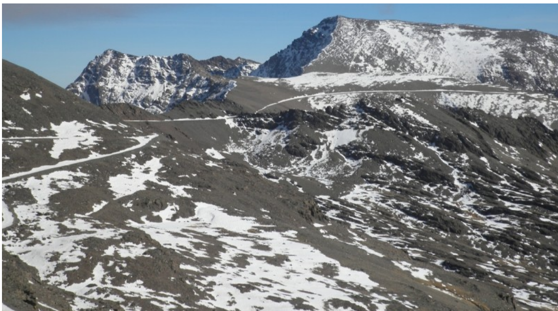
Mulhacén desde La Carihuela 18-11-2020