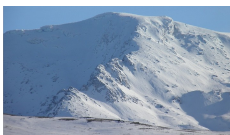
Corral del Veleta y Cartujo 27-1-21