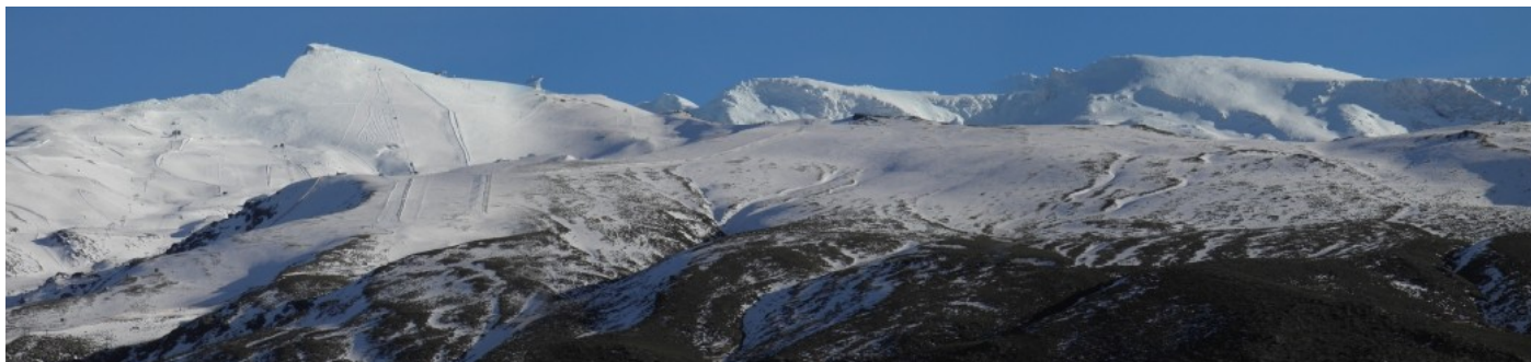
Veleta y Tajos de la Virgen 27 -1-21