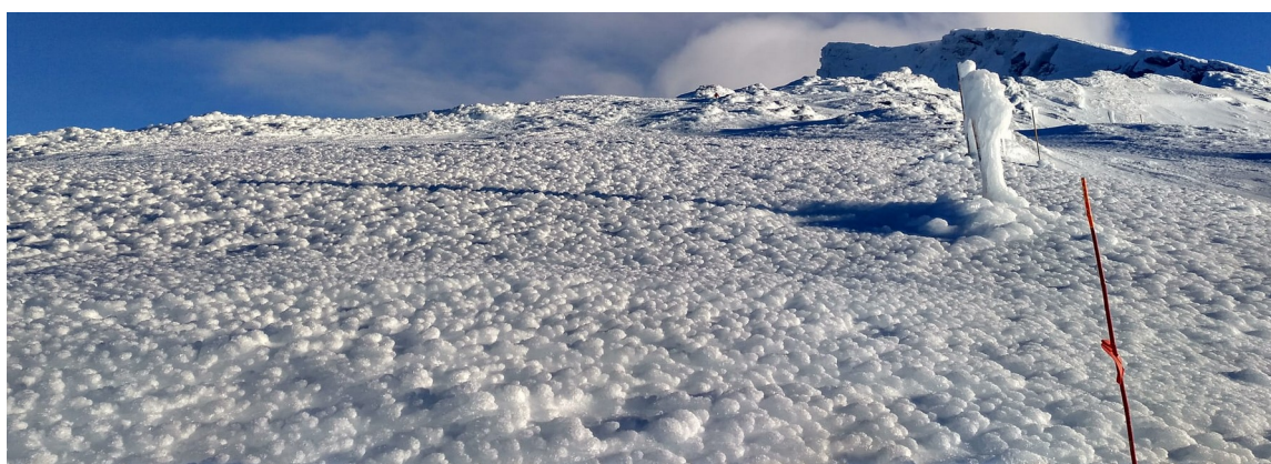
Condiciones difíciles para el desplazamiento 28-1-21