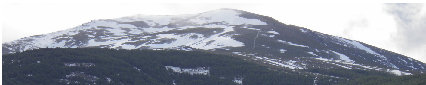
Chullo y cuerda de Los Morrones 10-2-21