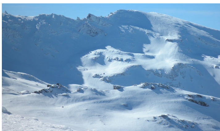
Veleta y acceso a Elorrieta 9 -2-21