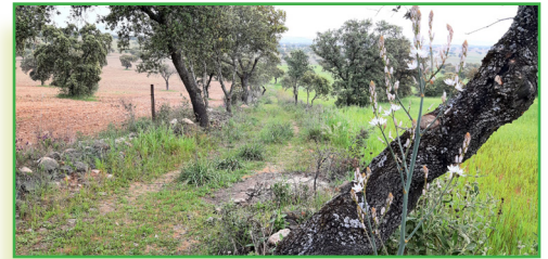
Tramo vereda ruta