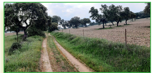
Dehesas en la ruta