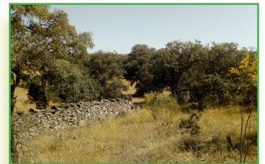
Mura de granito y dehesa