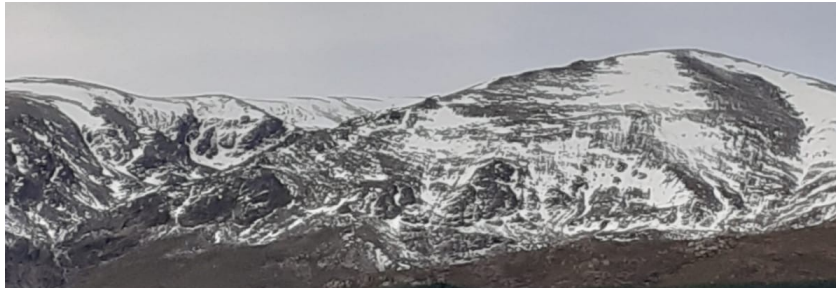
Picón de Jérez 20-12-22