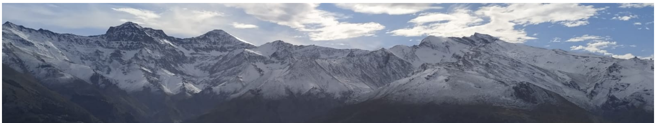
De la Alcazaba al Mulhacén 21-12-22