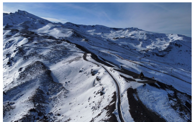
Vertiente norte 21-12-22