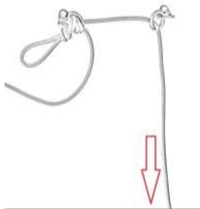
Nudo de 9 para descenso de último.

16. Si el/la equipador/a de competiciones estima que puede haber riesgo de bloqueo del ocho en retención y así se recomienda en la charla técnica inicial, se podrá montar un nudo empotrado tipo 8 o 9 conforme a la imagen adjunta