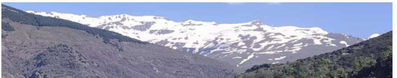
Cara sur 28-4-26