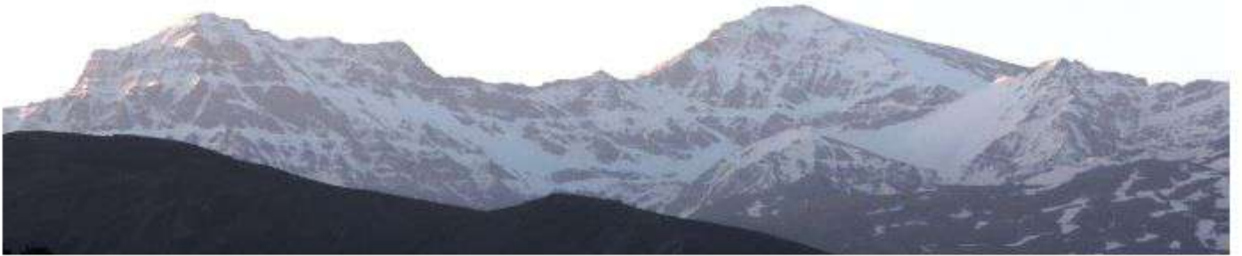
Alcazaba, Mulhacén y Veleta 28-4-26