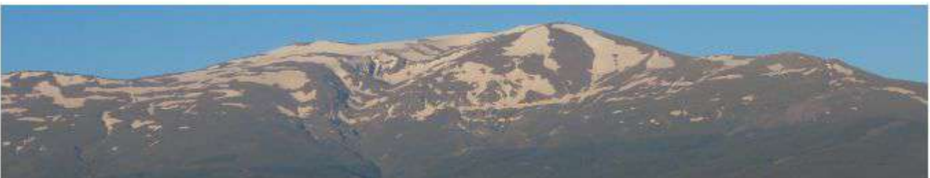
Picón de Jérez 6-5-26