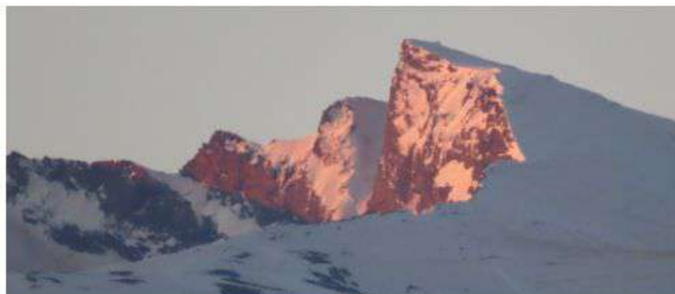
Cara norte Veleta 6-5-26

Continúa el riesgo de desprendimientos por toda la zona de cumbres de la sierra así que mucha precaución.