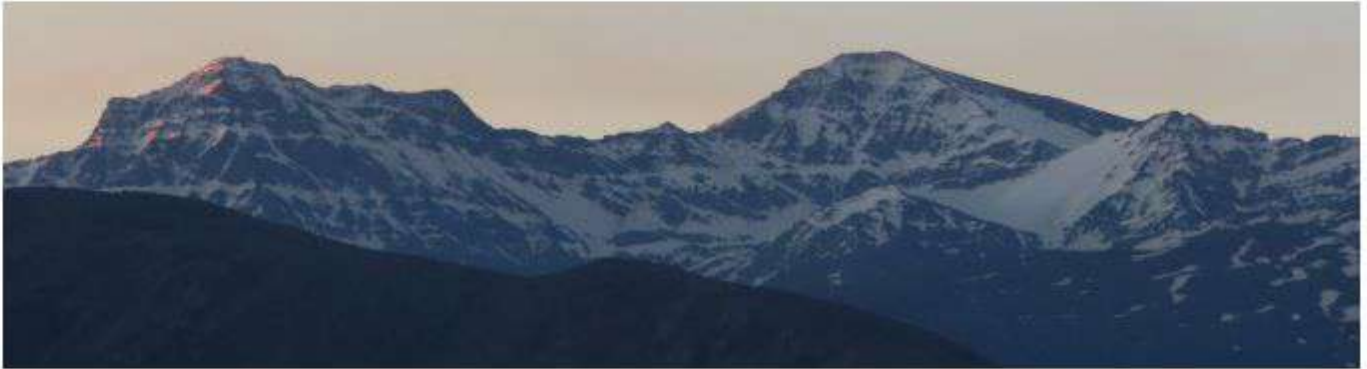
Alcazaba, Mulhacén y Veleta vertiente norte 6-5-26